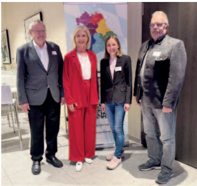
Text/Foto: Nina Hieronymus

gestärkt. Eine aktive Beteiligung der Seniorinnen und Senioren im Freistaat Bayern am sozialen, kulturellen und politischen Leben sind die Ziele des LSR. Die Vertreterinnen und Vertreter der Seniorenvertretungen aus den Gemeinden und Landkreisen sind in ihm Mitglied.