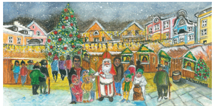
40. Nikolausmarkt - in Wartberg am Marktplatz